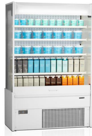
MD1100-SLIM väri valkoinen